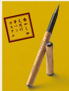
天然竹筆ペン 水性顔料インク カートリッジインク2本付き