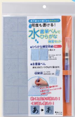
書筆ペンでひらがな練習セット 厚紙タイプ/B5サイズ