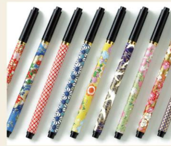
あかしや新毛筆【古都】(柄はランダムです) 水性染料インク