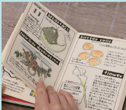
▲使用描画材 / マーカー・サインペン・色鉛筆