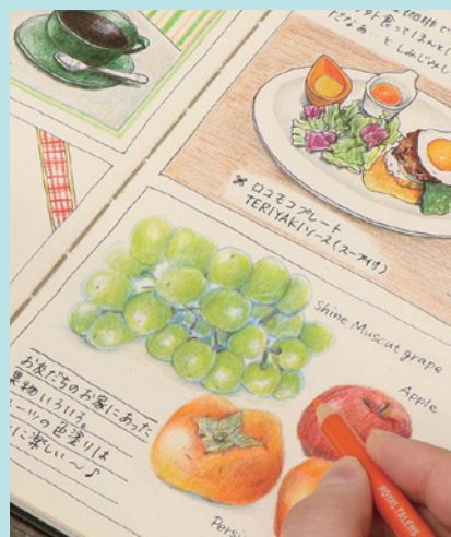
▲使用描画材 / 色鉛筆・サインペン