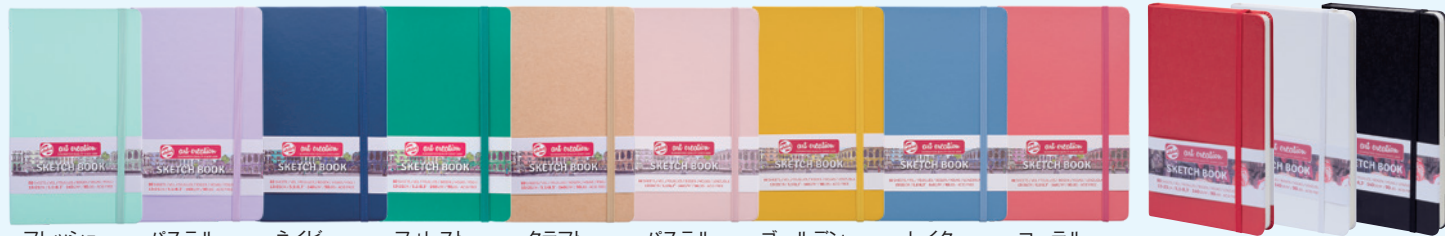
フレッシュ ミント