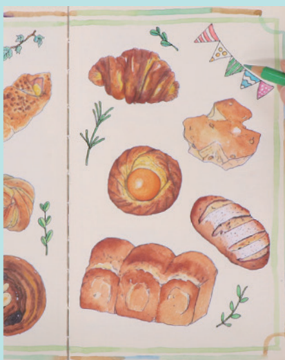
▲使用描画材 / サインペン・水彩絵の具・色鉛筆