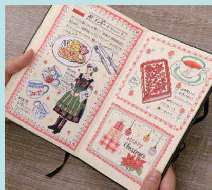
▲使用描画材 / サインペン・色鉛筆 左ページイラストは白い紙に描いてコラージュ?