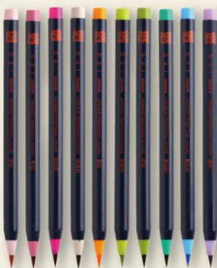
あかしや水彩毛筆【彩】 水性染料インク