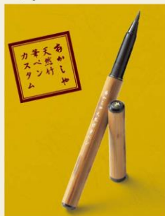
天然竹筆 水性顔料インク カートリッジインク2本付き