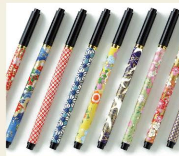
あかしや新毛筆【古都】(柄はランダムです) 水性染料インク