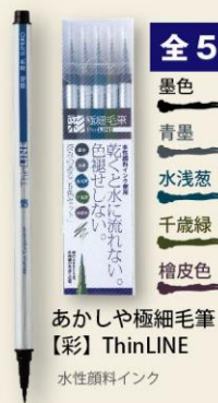
あかしや極細毛筆 【彩】ThinLINE 水性顔料インク