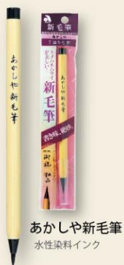
あかしや新毛筆 水性染料インク

ハレの日に似合う、美しい文字 伝統の「色と形」が織りなす洗練されたデザインに日本 の美を再発見！雅な京友禅柄と粋な江戸小紋柄で装 飾した毛筆ペン。