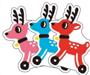
<ころころ鹿の活版ポストカード>