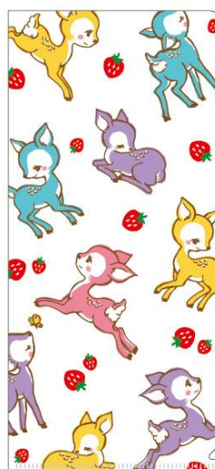
<バンビのチケットホルダー>

coto mono コトモノは... 「ならまち」と呼ばれる奈良の旧市街地にある文房具と雑貨のお店です。 格子戸をくぐって路地に入ると小さな看板と小さな扉。靴を脱いでゆっくりくつろげるまるで隠れ家のようなお店です。 店主のセレクトした懐かしくて楽しい国内外の文房具がぎっしり詰まっています。