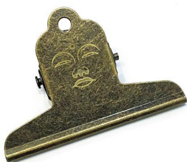
<リアル大仏クリップ>