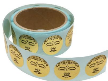
<水玉大仏ロールシール>